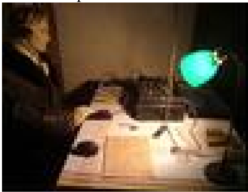
Interiör från hemlig radiostation bemannad av motståndsrörelsen

dagen D, den 6:e juni 1944. I södra Frankrike fälldede allierade ned fallskärmar med förnödenheter såsom mat, radioapparater, sprängmedel och granater som motståndsmännen använde för att sabotera för tyskarna och italienarna. Imponerande.