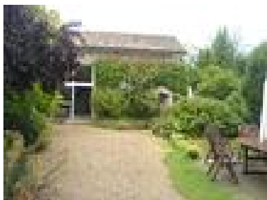
Entrén till Stallet